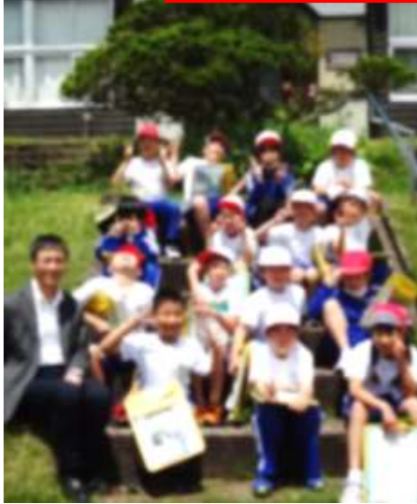
3年生地域巡り 本寺～山谷～達古袋