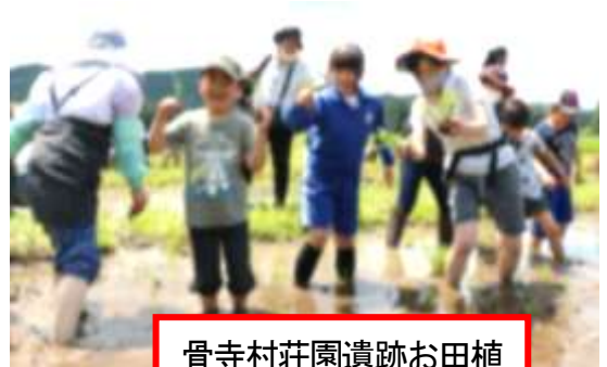
骨寺村荘園遺跡お田植