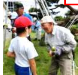
厳美人生大学庭園教室の 皆様による庭木の剪定 (3年生)