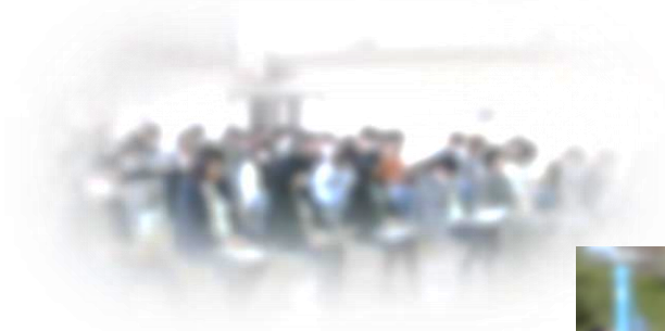
PTA 総会 保護者も真剣