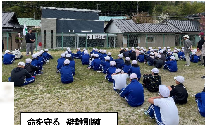
命を守る 避難訓練