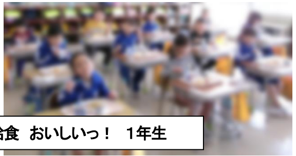
給食 おいしいっ！ 1年生