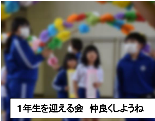
1年生を迎える会 仲良くしようね