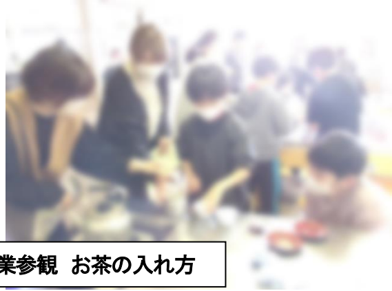
5年生 授業参観 お茶の入れ方