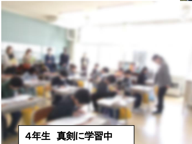
4年生 真剣に学習中