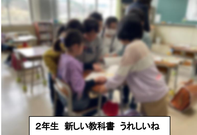
2年生 新しい教科書 うれしいね