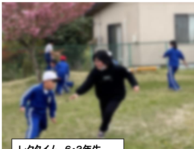
レクタイム 6・3年生