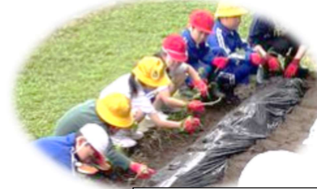
1, 2年生 サツマイモ植え