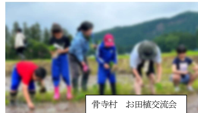
骨寺村 お田植交流会