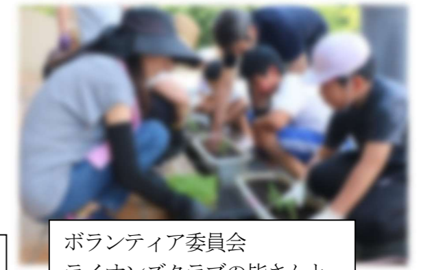
ボランティア委員会 ライオンズクラブの皆さんと