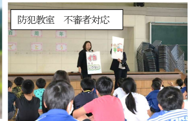
防犯教室 不審者対応

全国や県で行われている調査によると、テスト等の学力は、自然や文化施設の利用や地域との関わりの豊かさに関係があるそうです。 現行の学習指導要領による教科書では、今まで以上に日常生活に関わる出来事が取り上げられています。子どもたち自身が解決方法を考えたり、情報収集を行ったり、考えた内容を情報発信したりする内容になっています。巖美小学校の子ども子どもたちにとって、とても価値のある学習場面になっています。ご協力いただいた皆様、本当にありがとうございます。