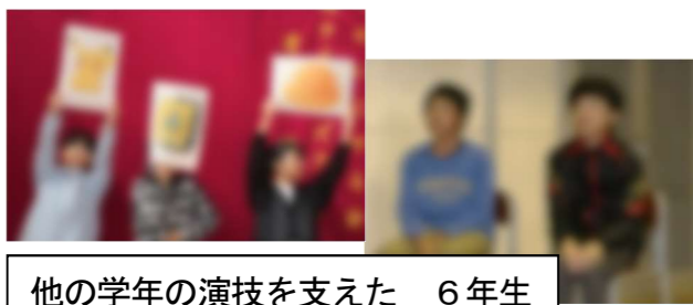
他の学年の演技を支えた 6年生