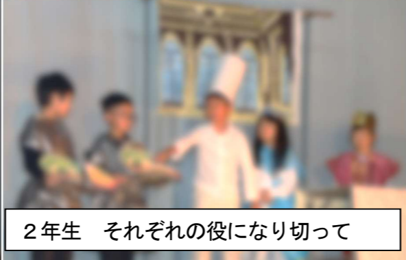
2年生 それぞれの役になり切って