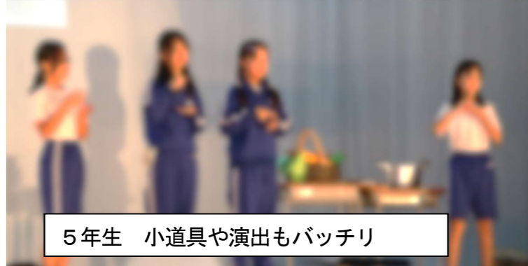
5年生 小道具や演出もバッチリ