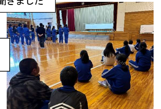
中学生の姿を すぐ真似しました