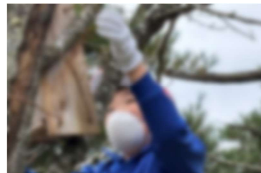
厳美溪をきれいに 巣箱清掃 5・6年

R6年度: 登校便出発時刻 結渡便【1号車】結渡発7:30 菅生沢便【2号車】(上菅生沢西発)7:38 達古袋便【3号車】(焼切発)7:39 長倉・猪岡便【4号車】(長倉公民館前発)7:30 板川・本寺便【5号車】…板川発7:25 横森・若井原便【6号車】横森発7:23 駒形・若神子便【7号車】…駒形7:33 小猪岡・岡山便【8号車】…前田7:22