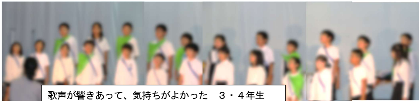
歌声が響きあって、気持ちがよかった 3・4年生